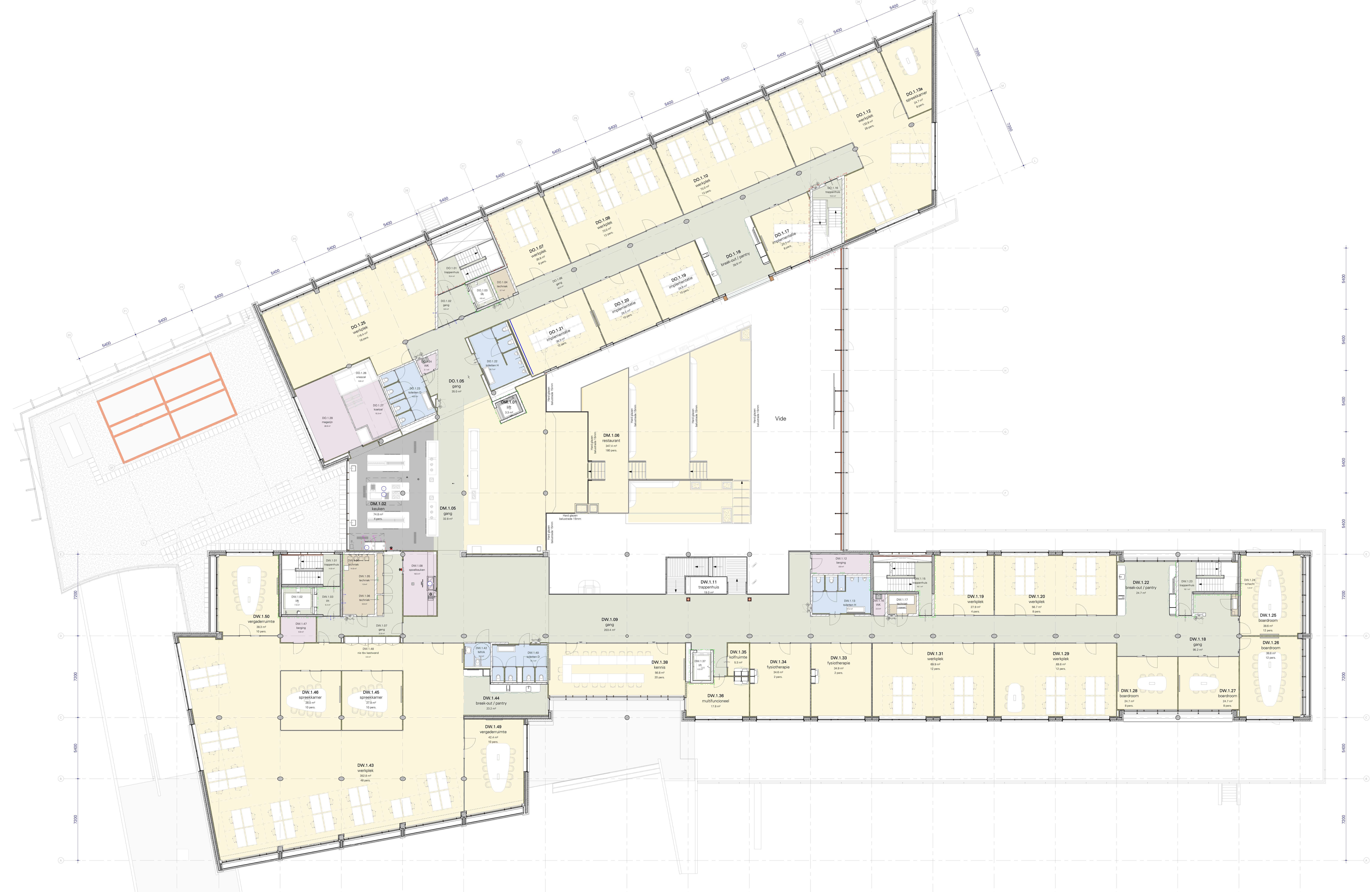
Plattegrond eerste verdieping